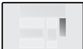
Pitkä taulu 250 x 750 px