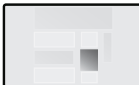
Boksi 405 x 360 px